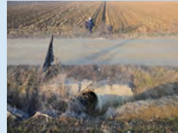
Conducción directa del agua hacia los ríos