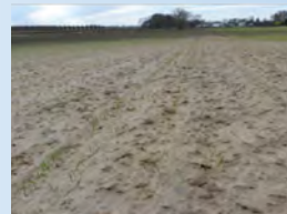
Encostramiento del suelo/grietas