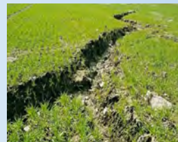
Erosión por cárcavas