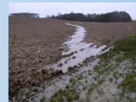
Concentración del flujo de agua en las vaguadas

Se han desarrollado herramientas de diagnóstico para evaluar las bases del diagnóstico)